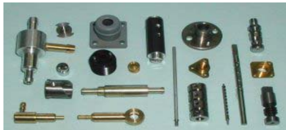
各種精密加工部品

デジカム、デジカム等の特殊精密ギヤードモーター(変速機付モーター)の国内シェア30%、OA機器用精密金属歯車の世界シェア35%。超精密機械加工部品、超精密小物成型部品、それらを組み合わせたユニット品を得意とする。