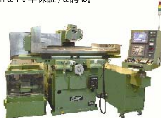
超精密成形平面CMC研削盤

金型製作や超硬・セラミックなどの難削材加工に欠かせない「超精密成形平面研削盤」を開発。世界に類を見ない追従・復元精度( \pm 0.001 mmを10年保証)を誇る。