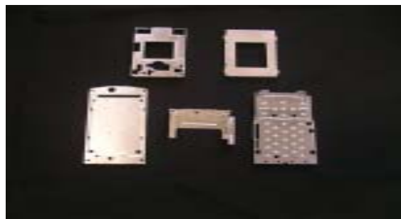
携帯電話の構造部品

液晶画面を固定するバックパネルの世界シェア10%。構造部品の薄型化と高密度実装に対応した複雑形状加工で、携帯電話の小型軽量化、高機能化に貢献。金型の機構部分を上下、左右、回転の3方向に動かす3軸プレス加工により、通常0.2mmの平面加工精度に対し、0.05mmの精度を誇る。