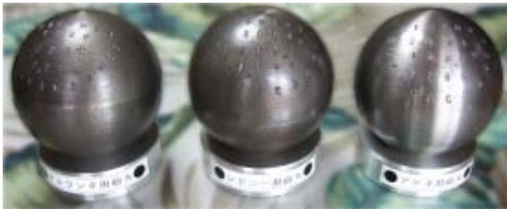
オリンピックでメダルを独占した砲丸

砲丸の重心は少しでもずれていると飛距離に1~2mの差が出ると言われているが、ひとつひとつ手作業により、削っているときの音、手に伝わる圧力、削り終えたときのツヤなどを総合的に判断する匠の技で、正確な重心を出している。