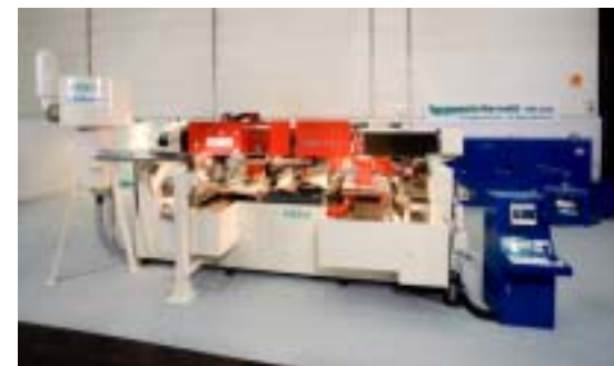
自動車用窓ガラス切断・折研磨機

世界6カ国で特許を有する自動車用ガラス研磨機で世界シェア60%、国内シェア80%。従来2台で行っていた切断、研磨の工程を1台でこなす「自動車用窓ガラスの切断・研磨機」は加工の短時間化とモデル変更への対応の迅速化を可能にした。